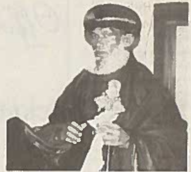
ብፁዕ ወቅዱስ አቡነ መርቆሪዎስ ፓትርያርክ ዘኢትዮጵያ