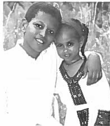
ብንያምና ሀና ነን

431 N. Indian Creek, Suite E (404)296-2766