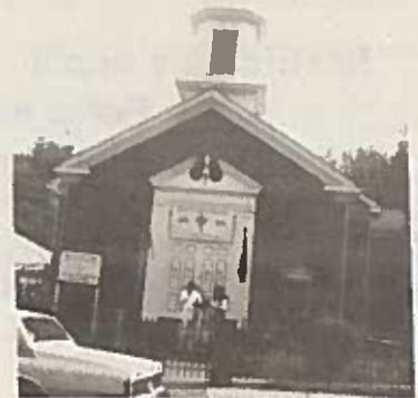
ሳህሊተ ምህረት ቅድስት ማርያም የኢትዮጵያ ተዋሕዶ ኦርቶዶክስ ካቴድራል

ሳንዳፍታ የገል መፅሔት ናት። የሚወጡ ጽሑፎች በሙሉ የአዘጋጁን እመለካከት ወይም እምነት ያንጸባርቃሉ ማለት አይደለም። ጽሑፎቹን በረዲያ፣ በቴሌቪዥን ሆነ በተመሳሳይ መንገድ በከፊልም ሆነ በሙሉ አባዝተው ለማሰራጨት የፀሐፊውንና የአዘጋጁን ፈቃድ ማግኘት ያስፈልጋል። በተለይ የፈጠራ ድርሰቶች መብታቸው በሕግ የተጠበቀ መሆኑን መገለጽ እንወዳለን። © COPYRIGHT LANDAFTA 1998