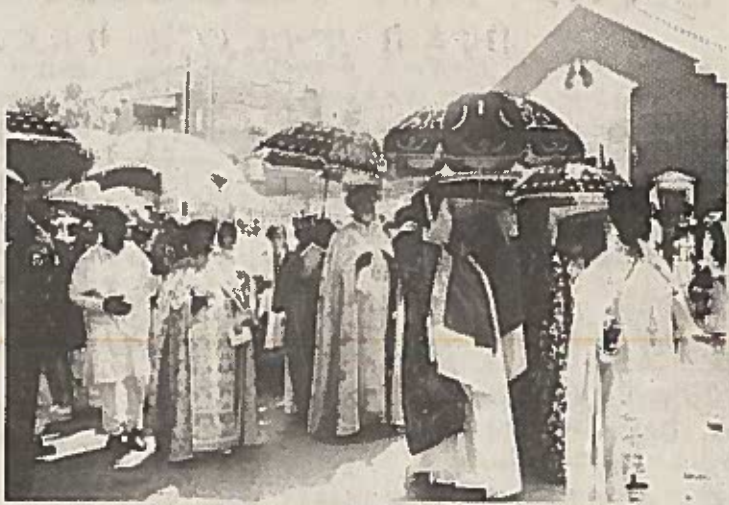
የቅድስት ማርያም ቅዱስ ሚካኤል ታቦታት