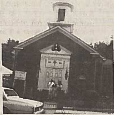
የአትላንታ ሳህሊተ ምህረት ቅድስት ማርያም ቤተ ካቴድራል