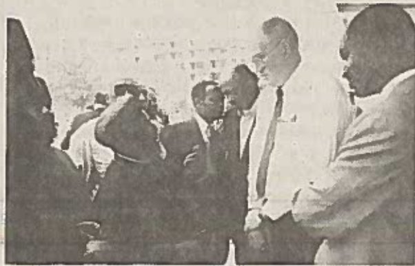
ብጹዕ አቡነ መልክጼደኛ ለIMF ተወካይ የኢትዮጵያውያንን ብሉት ሲያስረዱ