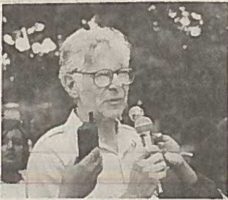
የኢትዮጵያ ወዳጅ ፕሮፍሰር ቬስታል