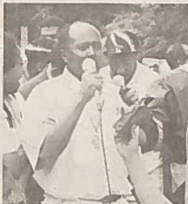
“አባቶቻችን እንድንቷን ጠብቀው ያቆዩልን አገራችን እንደት በእኛ ጊዜ ትኖረሱ...” ወጣት ንጉሤ መሸሻ