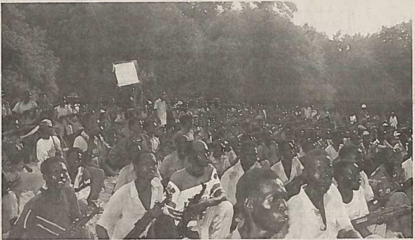
የኢትዮጵያ አንድነት ግምባር (ኢአግ) ሠራዊት በከፊል