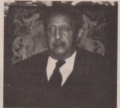
አዲ አምሐ ሥላሴ