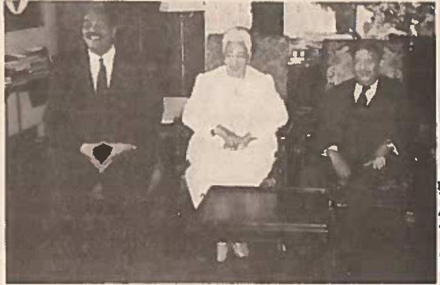
አፄ አምሐ ሥላሴ ከልዕልት መድረርያሽ ወርቅና ከልጃቸው ጋር

አስከሬናቸውም ወደ ኢትዮጵያ ተልኮ የቀብር ሥነሥርዓቱ ብዙ ሕዝብ በተገኘበት በደመቀ ሁኔታ መደረጉን ከአዲስ አበባ የደረሰን ዜና ይጠቁማል።