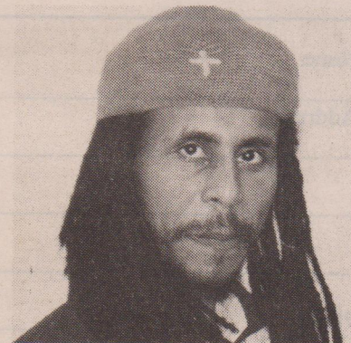
ባህታዊ ገብረመስቀል በእስር ላይ እያሉ ታመዋል ይባላል