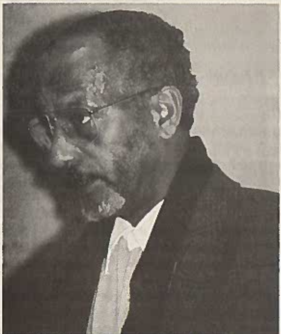
ሻለቃ ኢያሱ አያልቅበት

“ይህ የኢትዮጵያ አንድነት ሠራዊት በአሁኑ ጊዜ በሶስት ክፍል ሐገሮች በ4 የተለያዩ አካባቢዎች ውስጥ ተከፋፍሎ እየተንቀሳቀሰ ይገኛል። ይህ ሠራዊት በኢትዮጵያ ውስጥ ማለትም ወያኔ ከገባ በኋላ የተፈጠረ አዲስ እንቅስቃሴ ነው። አዲስ ነው ስንልም ከዚህ በፊት ያሉት ወይም የነበሩት የብሔር እንቅስቃሴዎች ያላቸውና አብዛኛዎቹ መገንጠልን የሚደግፉ ሲሆኑ አንዳንዶቹ እንደ ቤንሻንጉል፣ እንደ አፋር ሕዝብ እንቅስቃሴዎች ያሉት ደግሞ የራሳቸው የውስጥ መብት ተከብሮ የኢትዮጵያም አንድነት እንዲኖርና እንዲከበር የሚፈልጉ ናቸው። ይህ የኢትዮጵያ አንድነት ሠራዊት ግን መላው ኢትዮጵያን የሚመለከትና ለኢትዮጵያ አንድነት፣ ነፃነትና ክብር መስዋዕት ሆኖ መታገል የሚፈልግ ኃይል ነው።”