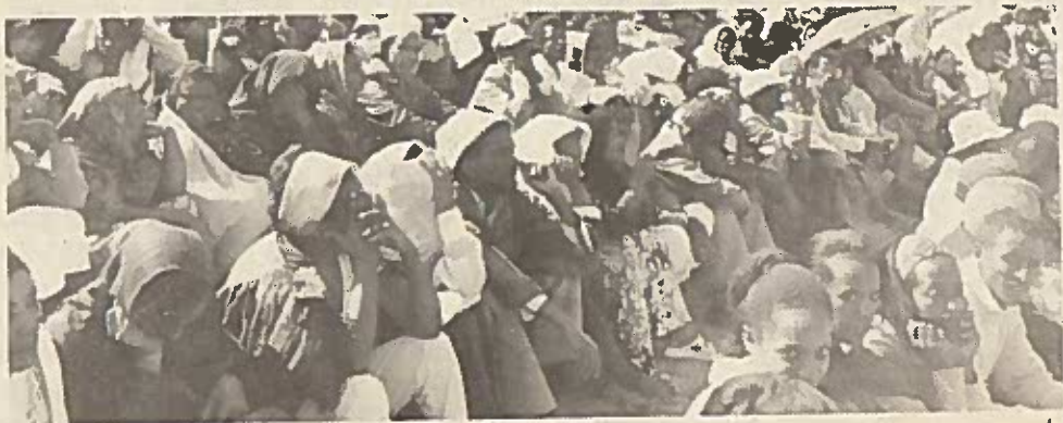
ሕገ መንግሥቱን በመደገፍ የወጡ ሰልፈኞች (እንዳንዶቹ ለምን ፊታቸውን ይሸፍናሉ?)