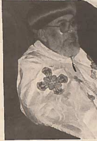
ብፁዕ አቡነ ይስሃቅ