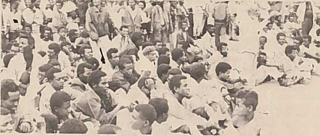
ሕገ መንግሥቱን በመቃወም የተደረገው ሕዝባዊ ስብሰባ በከፊል