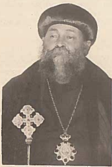
ብፁዕ አቡነ ዜና ማርቆስ