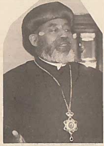
ብፁዕ አቡነ መልክዴዴቅ