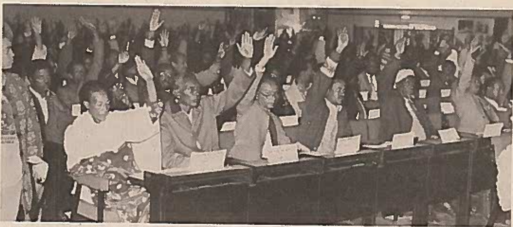
በመጨረሻም የሰማውም፣ ያልሰማውም፣ የገባውም ያልገባውም "ተስማምቻለሁ" ብሎ እጁን ጣራው እስኪነካ አወጣው፤ ሹማምንቶቹም አዩለት።

የሕገመንግሥት አጽዳቂ ጉባኤተኛ ገሚሱ አዲስ ታሪክ ሲያስተምር፣ ገሚሱ ሲነታረክ፣ ገሚሱ ሲሳደብ፣ ገሚሱ አዳማቂ፣ አሜሪካ ሆኖ፣ ገሚሱ እንቅልፋን ሲለጥጥ አንዳንድም ነጠላውን ሲቋጭ ከተቤ ላይ ሱባኤ ገብቶ ከረመ።